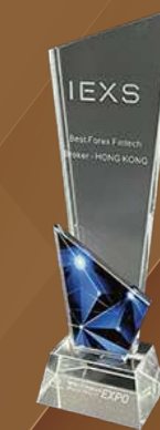
Broker Fintech Forex Terbaik-Asia

Pada September 2021, IEXS dianugerahkan anugerah "Broker Fintech Forex Terbaik di Eropah untuk tahun 2020". Anugerah ini diberikan selepas analisis komprehensif terhadap syarikat-syarikat yang mencapai prestasi terbaik di pelbagai pasaran dan merupakan salah satu penilaian tahunan yang paling berwibawa dan berpengaruh dalam industri ini.