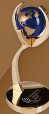
Broker Fintech Forex Terbaik

IEXS telah terus-menerus menerima pengiktirafan dan anugerah dari institusi yang berwibawa, menonjolkan kekuatan syarikat dalam keselamatan dana, asas perniagaan, dan perkhidmatan perdagangan, serta mencerminkan falsafah perkhidmatan syarikat yang berorientasikan pelanggan. Anugerah ini terutamanya mengiktiraf broker yang mencapai prestasi terbaik di peringkat global dan serantau, memberi ganjaran kepada syarikat yang menyediakan teknologi perdagangan terbaik, perdagangan dengan kos rendah, alat penyelidikan pasaran yang komprehensif, program pendidikan yang canggih, dan perkhidmatan pelanggan bertaraf dunia kepada pelabur atau pedagang.