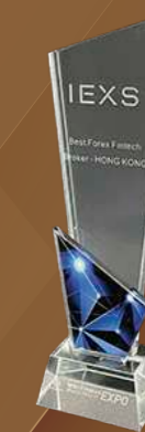
Broker Fintech Forex Terbaik-Asia

Pada September 2021, IEXS dianugerahkan anugerah "Broker Fintech Forex Terbaik di Eropah untuk tahun 2020". Anugerah ini diberikan selepas analisis komprehensif terhadap syarikat-syarikat yang mencapai prestasi terbaik di pelbagai pasaran dan merupakan salah satu penilaian tahunan yang paling berwibawa dan berpengaruh dalam industri ini.